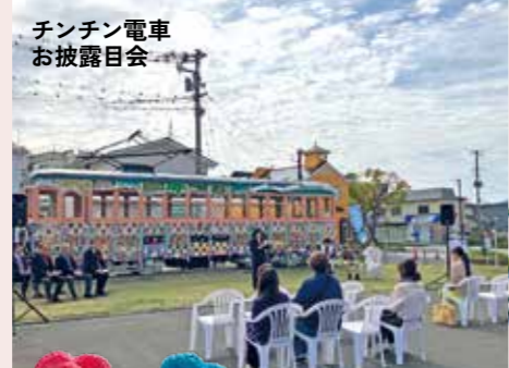
チンチン電車お披露目会