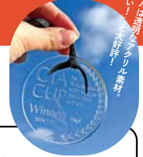
メダルは透明なアクリル素材。 「エホー!」と大好評!

地域スポーツを応援する「CIA杯」。 CIAは冠大会を通して、地域のスポーツ活動を支援しています!