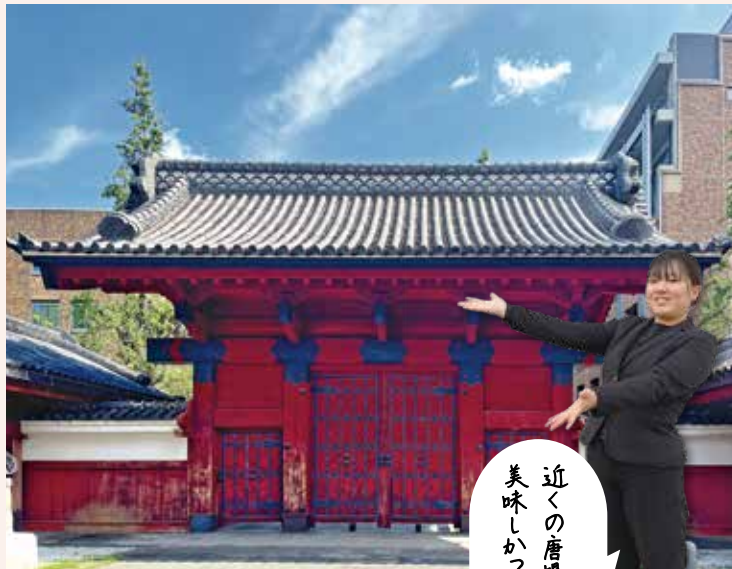
近くの唐揚げ屋さんが美味しかったです!

だったので、感無量です。 すれ違う東大生たちの会話は難しすぎて、ほぼ宇宙語。それでもキャンパス内を歩いていると、なぜか私も少し賢くなったような気分になりました。 その日以来、会社では「東大卒」と呼ばれています。満更でもないです。 (映像・武藤)