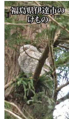
福島県伊達市のけもの 地味に再生回数を増やす伊達市のけものシリーズ

ショート動画の他にもたくさんの傑作名作珍作動画を配信! 大きなことから極小なことまで伊達から世界へ発信!