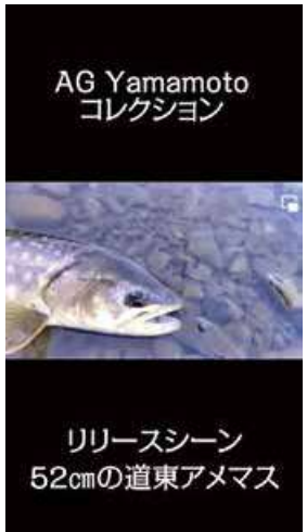
リリースシーン 52cmの道東アメマス