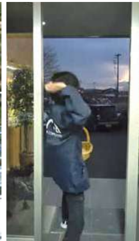
豆まきです。CIA は季節の行事を大切にしています。