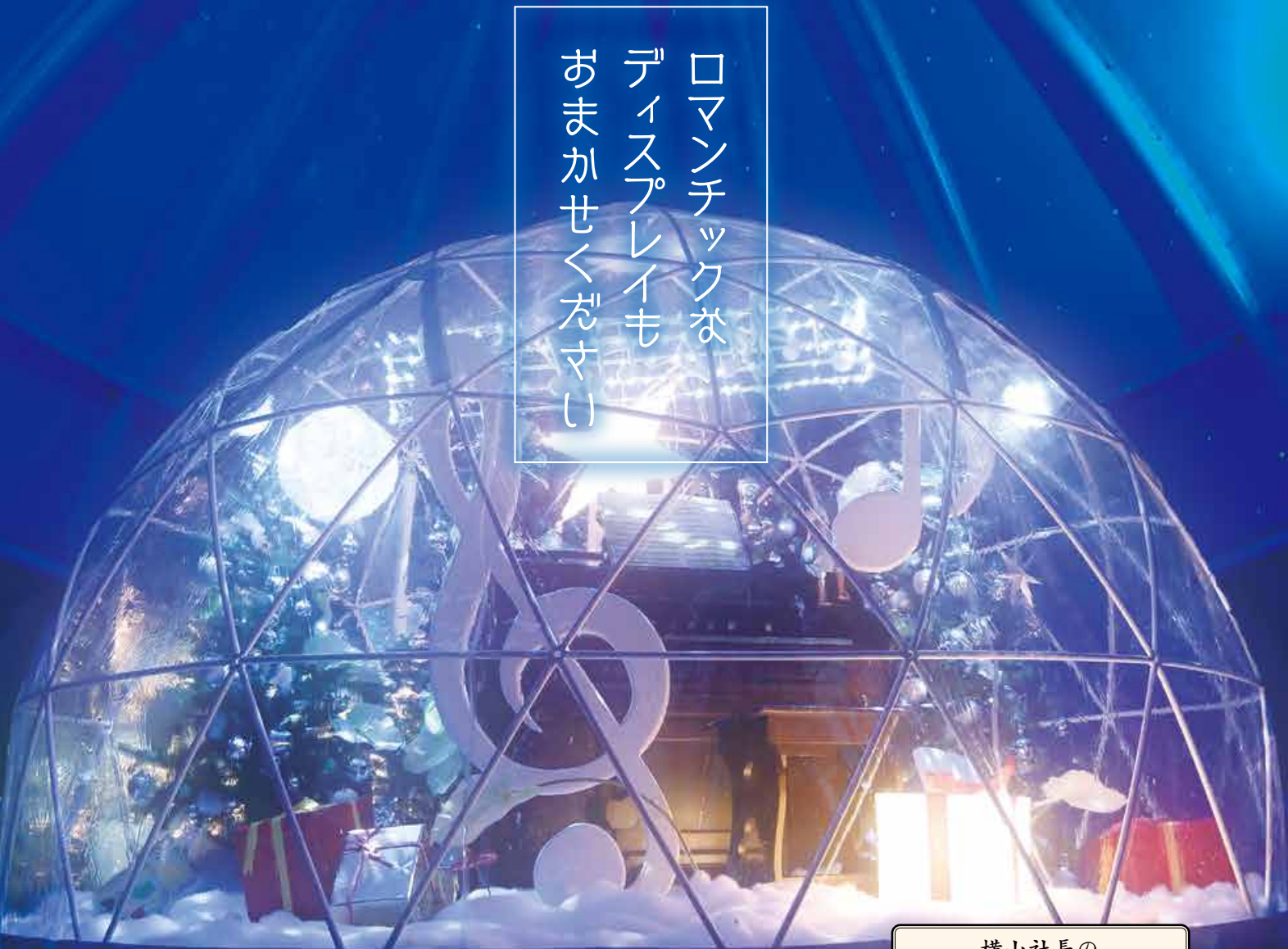
道の駅 かわまたの巨大スノードーム