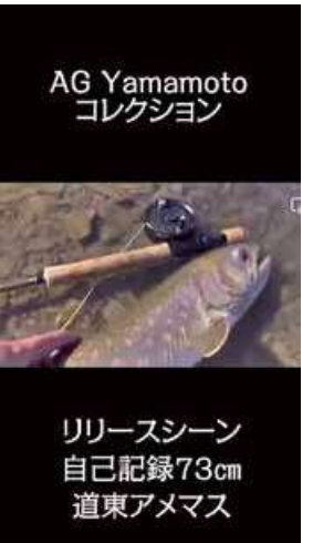
リリースシーン 自己記録73cm 道東アメマス