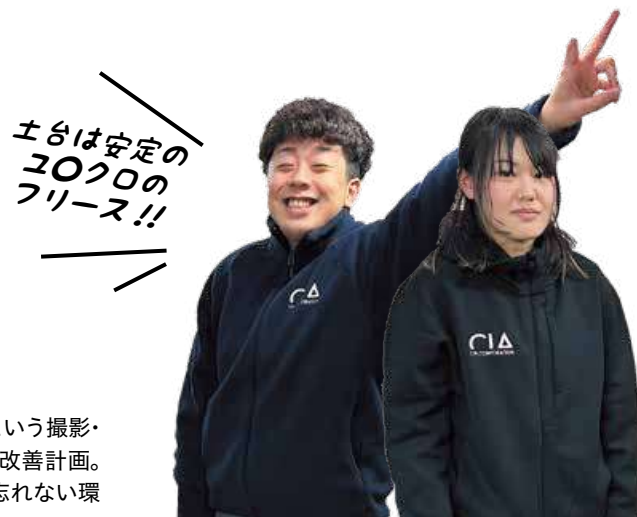
秋冬用フリース 撮影・配信用パーカー

「動いても音のでないユニフォームが欲しい」という撮影・配信担当の声から始まった会社ユニフォーム改善計画。ペットボトルを再利用した生地で、SDGsも忘れない環境に優しいユニフォームです。