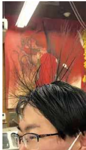
寝癖じゃありません。加工担当者は静電気です。サイヤ人になる!?