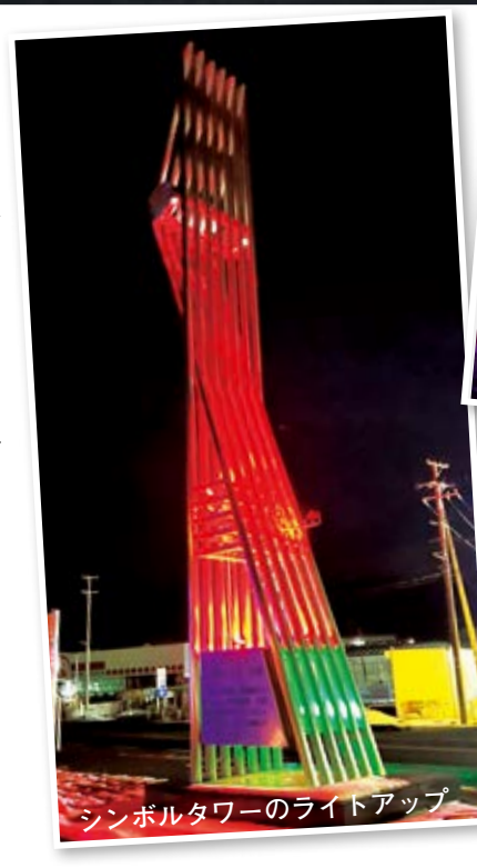
シンボルタワーのライトアップ

さらに、川俣町特産品のアンズリウムを華やかに装飾したツリー、おりもの展示館の外壁やシンボルタワーのライトアップなども行っています。クリスマス仕様から年末年始のニューイヤース仕様まで、イベントに応じて模様替えをしています。現在はバレンタイン仕様になっています。