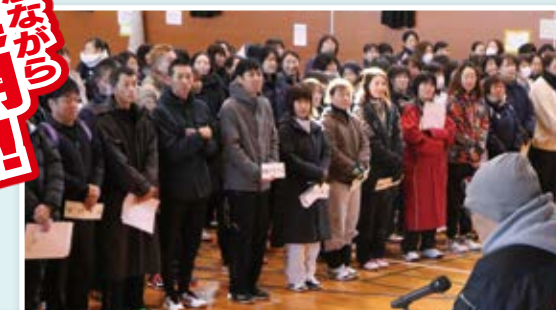
オリジナルメダル贈呈