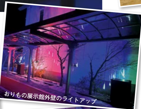
おりもの展示館外壁のライトアップ