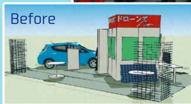
◀ブースデザイン案