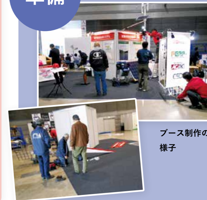
ブース制作の様子